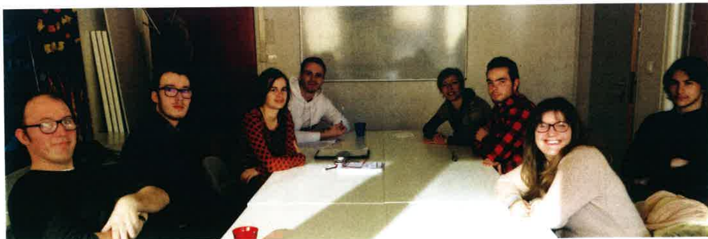
Groupe d'habiletés sociales

Pour les familles qui bénéficient de l'AEEH et d'un complément, le montant facturé est de 25 € de l'heure. Il est à noter que la famille reçoit l'année suivante un crédit d'impôts 50 % des facturations annuelles.