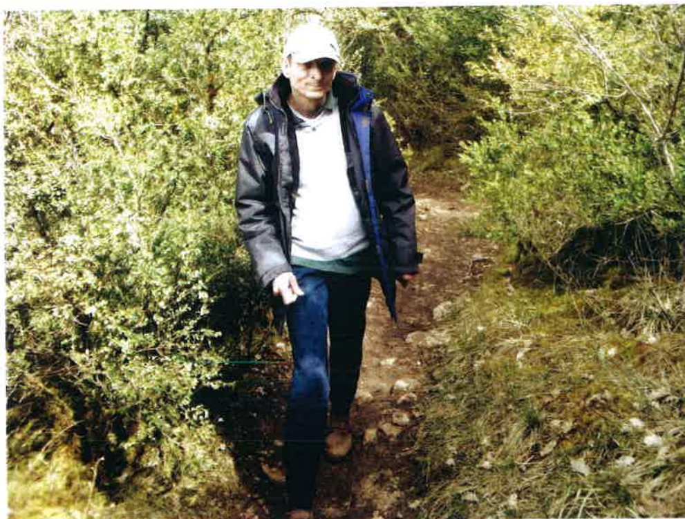
Gilles - Balade en forêt